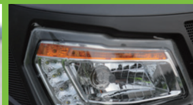
Lampu kombinasi, untuk menjamin keamanan operasi pada kondisi minim cahaya.