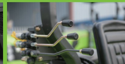
Desain tuas multi-valve yang inovatif, membuat pengoperasian menjadi lebih praktis.