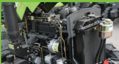
Mesin berkualitas tinggi, bertenaga kuat, dan hemat bahan bakar.