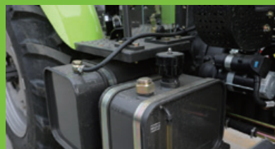
Oli hidrolik terpisah untuk kemudahan perawatan.