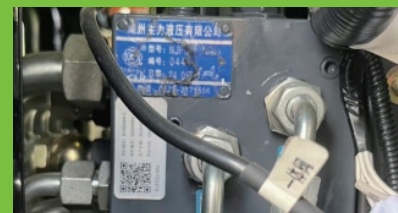
Hidrolik Kontrol Electromagnet