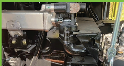
Mesin dengan Turbo Charger

Bobot unit ini 10% lebih ringan dibandingkan produk kompetitor, dan tingkat pertumbuhan bibit (seedling emergence rate) aktual yang terukur dari operasi bajak rotari crawler ini mencapai lebih dari 80%. Angka ini mencapai level terbaik di industri dan lebih dari dua kali lipat dibandingkan traktor roda.