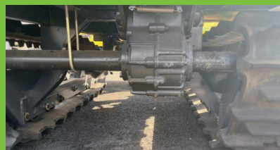
Gearbox Tipe 80