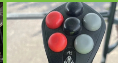
Kontrol Joystick Tunggal